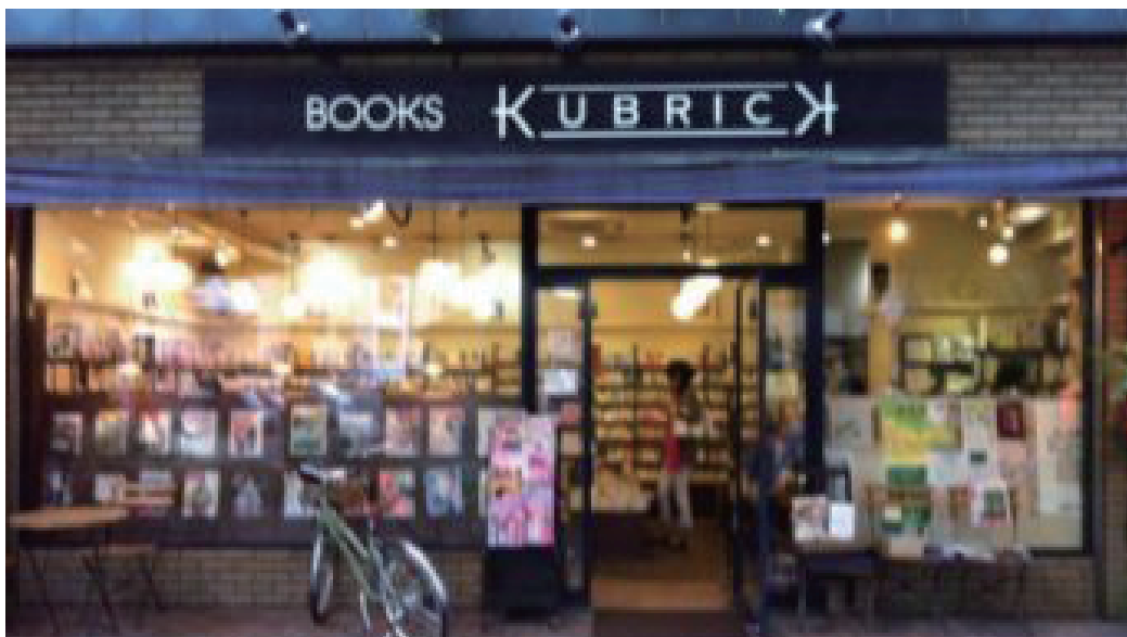
朝の集合場所① ブックスキューブリックけやき通り店